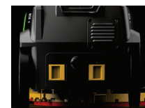
BATERIA DE ION DE LÍTIO