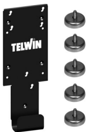
HOLDING BRACKET KIT 803086