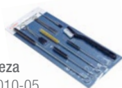
Kit de Limpeza Código G90010-05

Kit de limpeza Pistola PROLAQ Embalagem com 17 peças