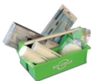
Caixa de Ferramentas Prolaq Código G90010-01

Nossas Caixa de Ferramentas incluem: óculos de proteção, luvas, filtros de cartucho, pré-filtros e um kit de limpeza de pistola.