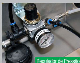
Regulador de Pressão