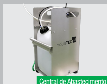
Central de Abastecimento