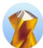
Brocas de fenda profunda