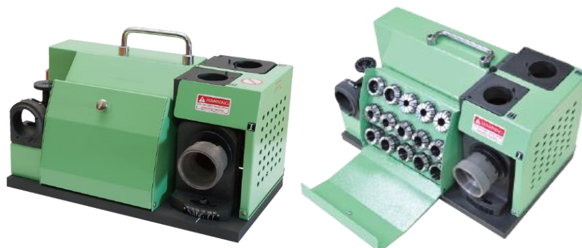
Brocas de torção GS-7 90° -140°