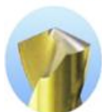
Brocas de torção