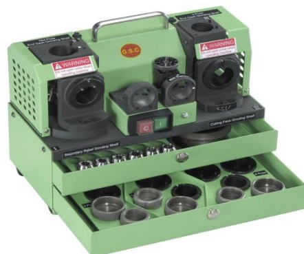
Fresa GS-6 de 2 flautas, 3 flautas e 4 flautas