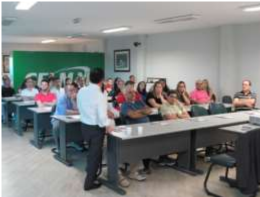
Workshop - MITUTOYO