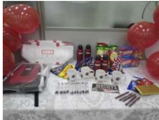
Workshop - DORMER