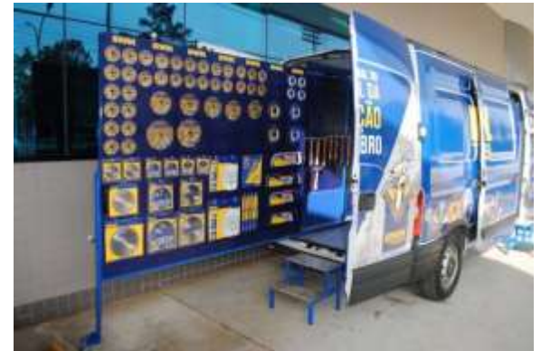
Demo Car - IRWIN