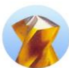
Brocas de fenda profunda