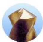
Brocas de torção