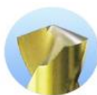
Brocas de torção