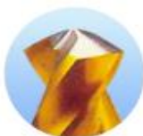
Brocas de fenda profunda