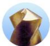
Brocas de torção